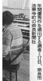
年間優秀作を提出する選手17日、奈良市法華寺町の奈良新聞社