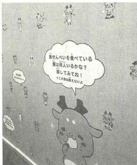
⑥奈良市観光協会のマスコットキャラクター「しかまろくん」。宿泊する部屋にはいないが、室内には若草山の芝を模した緑色のラグマットが敷かれている。⑦トイレ内には壁一面にしかまろくんのイラストがプリントされ、「クイズ」もある。いずれも奈良市のホテルアジール・奈良で

◇ホテルアジール・奈良 奈良市油阪町の58。「アジール」とは古代ギリシャ語で「癒やし・聖域」の意。「しかまろくんルーム」は3月20日から予約・販売(1泊2食付きで税別1人1万2000円から)を始める。予約や問い合わせは同ホテル(0742・22・5577)。