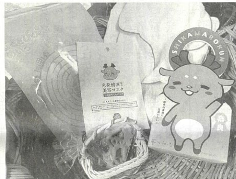
子ども用の特製プレート。しかまろくんの顔がアレンジされている