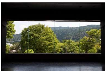
四季折々の景色で京都のインスタスポットとしても人気の東山・蹴上エリア