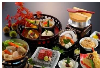
京都のお惣菜をバランスよく考えた「一汁三菜、五菜、七菜」毎日、おいしく・健康的に食べられるような定食やワンプレートを提供