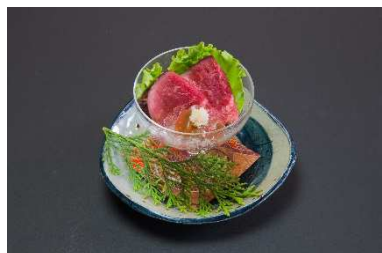
食肉餓鬼のご馳走